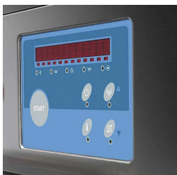
ALL-IN-1 Este innovador sistema se ha desarrollado para facilitar el mantenimiento y la limpieza diarios de la máquina