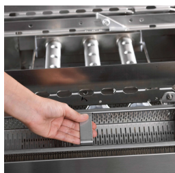
Pannello di controllo elettromeccanico con digitalizzazione