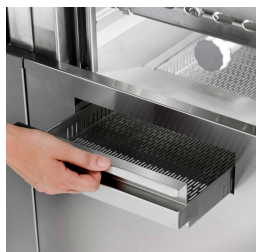
rivoluzionario sistema di filtrazione garantisce all'utilizzatore finale un processo di filtrazione a 3 step