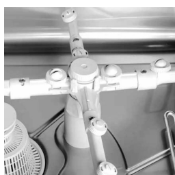
Roues légères en composite, efficaces même à faible pression de réseau