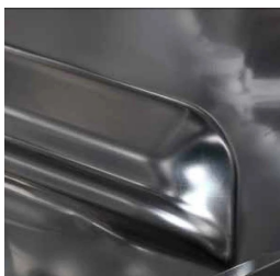
Giranti leggere in materiale composito, efficienti anche con bassa pressione di rete