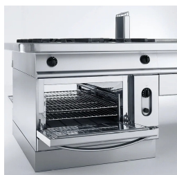
Gas-Durchlaufofen mit den Maßen 53,9x101,8x29,23 cm.