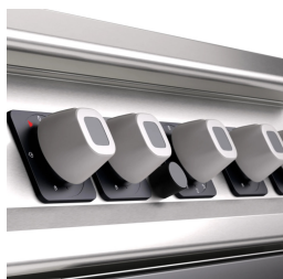
Dank der Zertifizierung als strahlwassergeschützt (IPX5), die durch spezielle Tests erreicht wurde, können die Knöpfe und Unterknöpfe gewaschen werden, ohne dass die Funktionalität und Sicherheit beeinträchtigt wird.