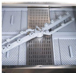
Giranti leggere in materiale composito, efficienti anche con bassa pressione di rete