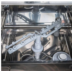
Bassin moulé et incliné pour une vidange parfaite