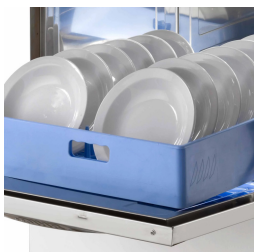
Porta in doppia parete