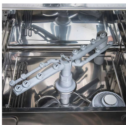
Cubeta moldeada e inclinada para un vaciado perfecto